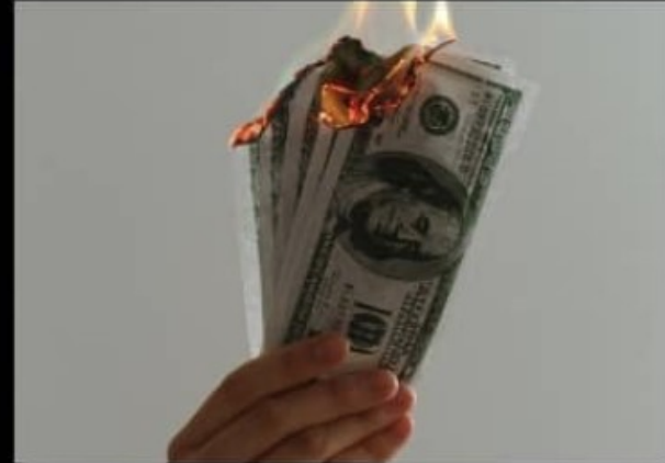
Mitä yhteiskunta ajattelee sinun tekevän