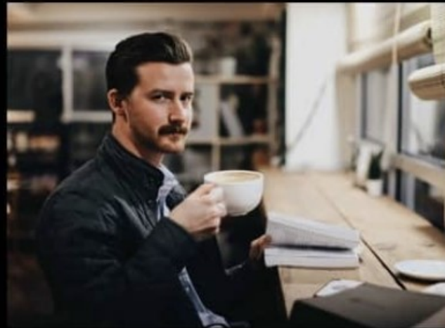
Mitä asiakkaat ajattelevat sinun tekevän