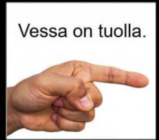
Mitä oikeasti teen