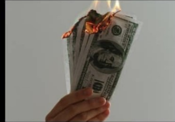
Mitä yhteiskunta ajattelee sinun tekevän