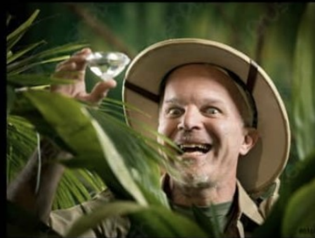
Mitä itse luulen tekeväni