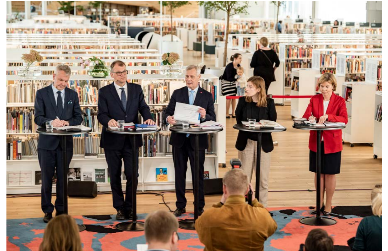
PUHEENJOHTAJA ANTTI RINTEEN JOHDOLLA KÄYTYJEN HALLITUSNEUVOTTELUJEN TULOS JULKAISTIIN KESKUSTAKIRJASTO OODISSA 3.6.2019.

Syytä uskoon onkin, sillä Suomen yleisissä kirjastoissa paukuteltiin ennätyksiä vuonna 2019. Tuoreen Helsingin keskustakirjasto Oodin kävijämäärä ylitti