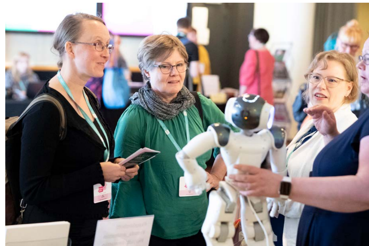
OSALLISTUJIA KULTTUURITALOLLA KIRJASTOPÄIVILLÄ 2019.