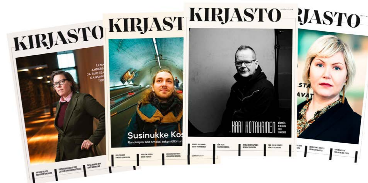
KIRJASTOLEHDEN KANSIA VUODELTA 2019.